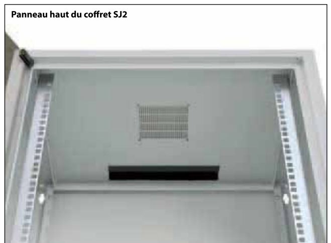
Panneau haut du coffret SJ2