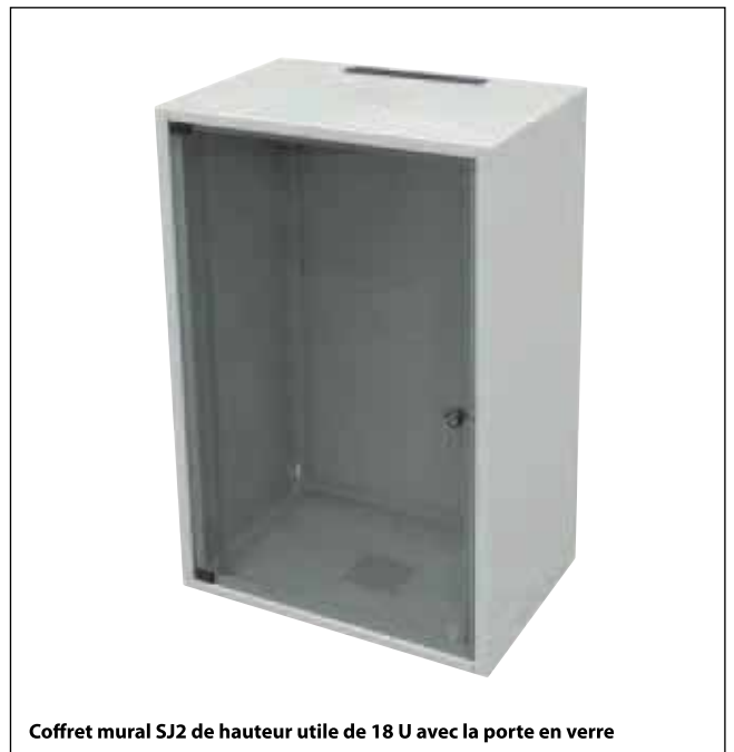
Coffret mural SJ2 de hauteur utile de 18 U avec la porte en verre

Les coffrets sont emballés en cartons. Dans l'emballage on dispose un patron pour tracer les points de perçage (correspondants aux ouvertures du coffret) à faire sur le mur.