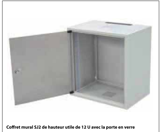
Coffret mural SJ2 de hauteur utile de 12 U avec la porte en verre