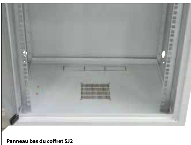
Panneau bas du coffret SJ2