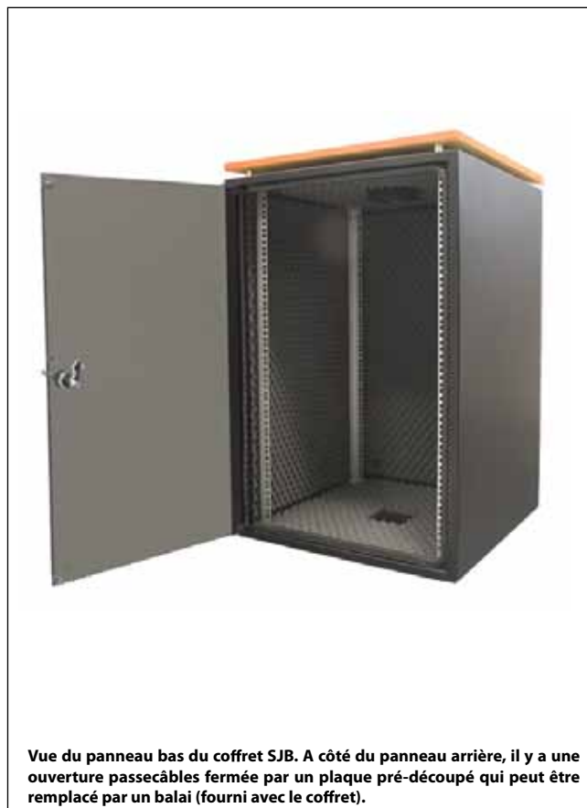
Vue du panneau bas du coffret SJB. A côté du panneau arrière, il y a une ouverture passécâbles fermée par un plaque pré-découpé qui peut être remplacé par un balai (fourni avec le coffret).