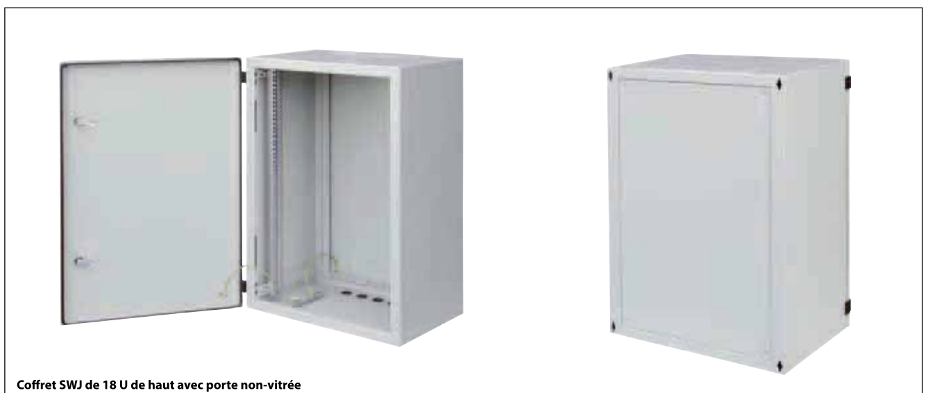
Coffret SWJ de 18 U de haut avec porte non-vitrée