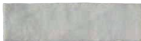
Mousse filtrante pour le coffret SWJ