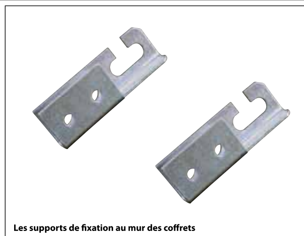
Les supports de fixation au mur des coffrets