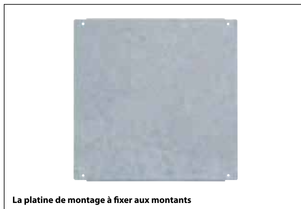
La platine de montage à fixer aux montants