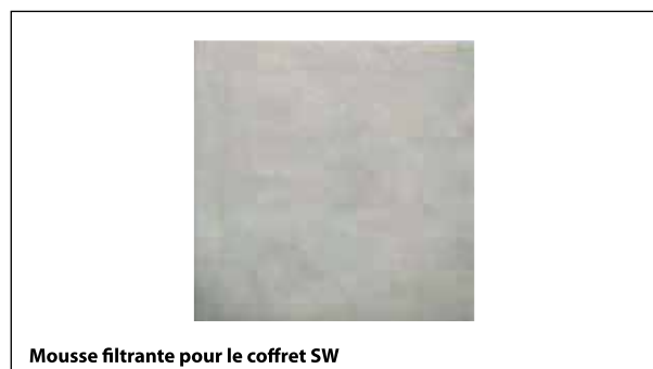
Mousse filtrante pour le coffret SW