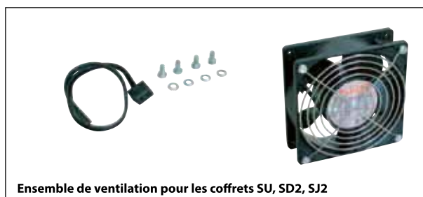
Ensemble de ventilation pour les coffrets SU, SD2, SJ2