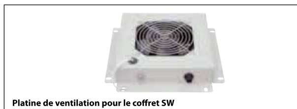
Platine de ventilation pour le coffret SW