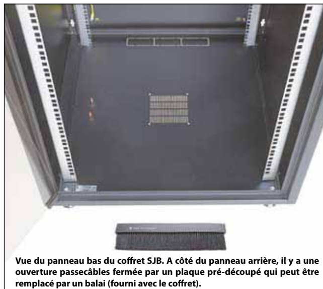
Vue du panneau bas du coffret SJB. A côté du panneau arrière, il y a une ouverture passécâbles fermée par un plaque pré-découpé qui peut être remplacé par un balai (fourni avec le coffret).