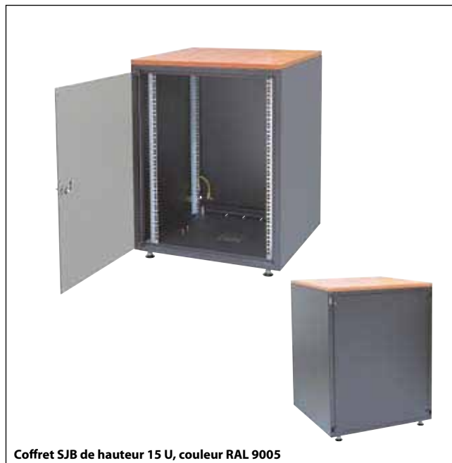
Coffret SJB de hauteur 15 U, couleur RAL 9005